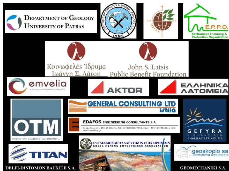
Χορηγοί 12 ου Διεθνούς Συνεδρίου Ελληνικής Γεωλογικής Εταιρίας

Είναι γεγονός ότι το Συνέδριο εξελίχθηκε και τελικά πραγματοποιήθηκε σε μια δύσκολη οικονομική συγκυρία για τη χώρα μας. Και στην περίπτωση όμως αυτή η έγκαιρη κινητοποίησή μας πριν ένα ολόκληρο χρόνο και όχι την τελευταία στιγμή μας επέτρεψε να επιτύχουμε τη στήριξη των χορηγών που αναφέρονται στους τόμους και στο πρόγραμμα, έτσι ώστε να ανταποκριθούμε στις υποχρεώσεις μας και ιδιαίτερα στην έκδοση των τόμων των Πρακτικών.